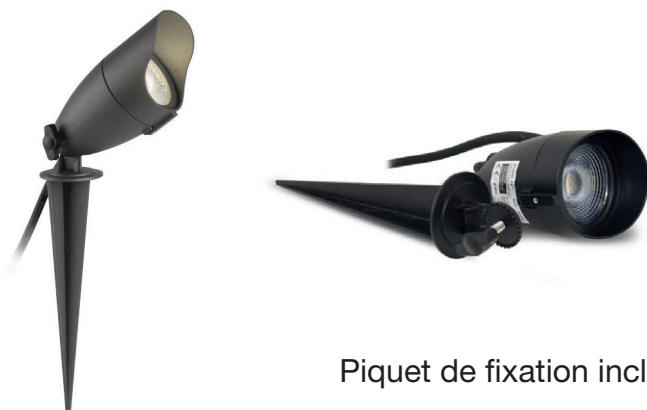
Piquet de fixation inclus